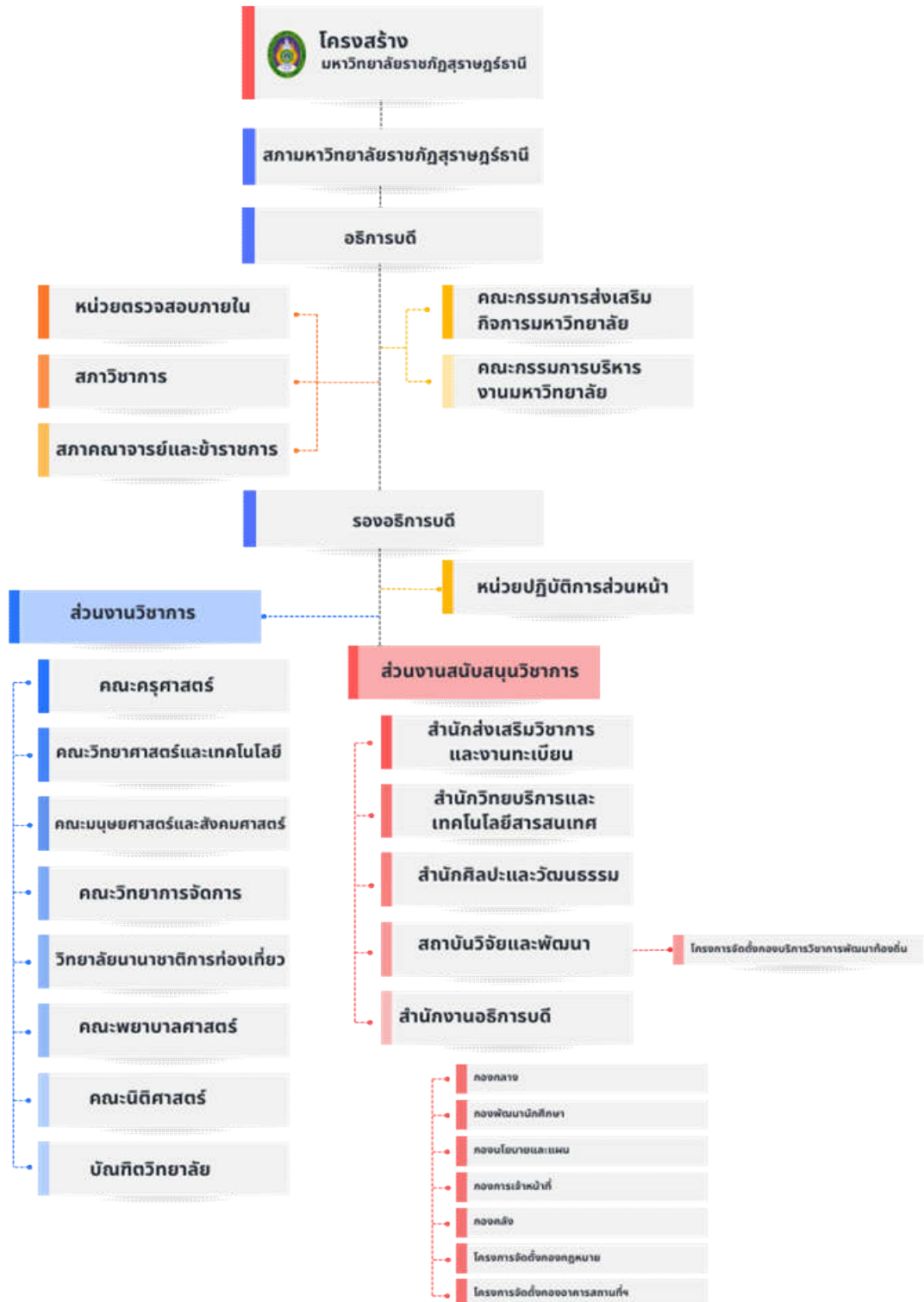
ภาพที่ 1.1 แสดงโครงสร้างหน่วยงานภายใน มหาวิทยาลัยราชภัฏสุราษฎร์ธานี